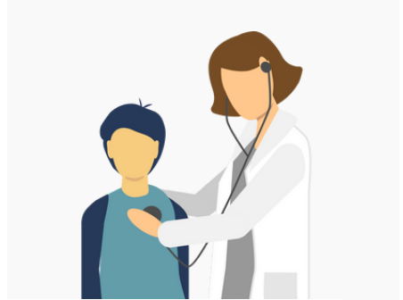
Recht auf Gesundheit