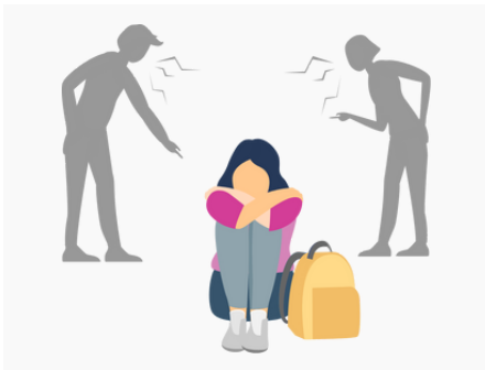
Recht auf gewaltfreie Erziehung