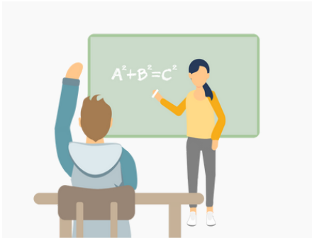
Recht auf Bildung