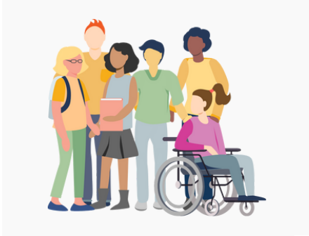
Recht auf Gleichheit