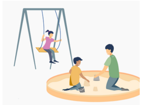
Recht auf Spiel und Freizeit